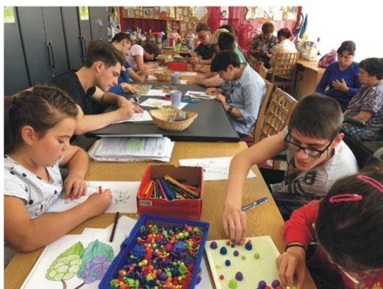
-Activități cu copiii/tinerii din filiala Prahova-